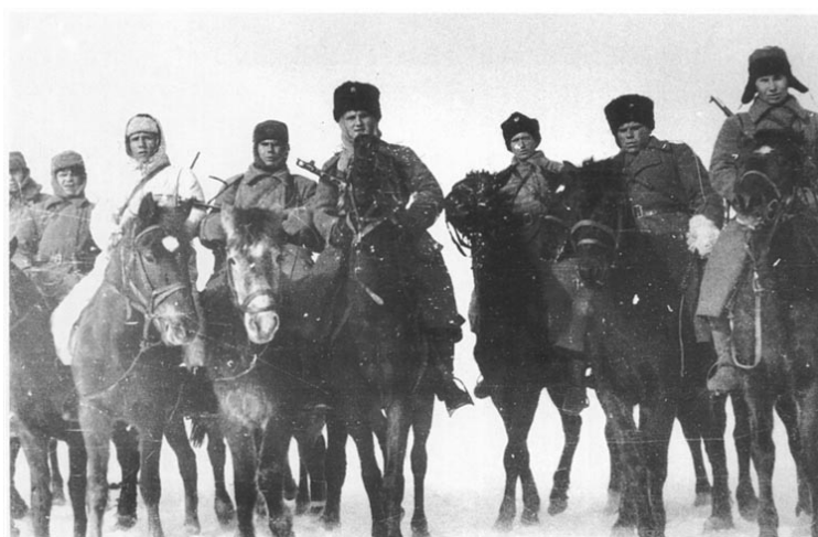
Рис. 1. Одно из казачьих подразделений в Вермахте (январь 1943 г.)

Весной 1943 г. отступившие вместе с немецкой армией с Кавказа казачьи полки были пополнены в Херсоне за счет беженцев с Кубани, Дона и Терека и объединены в дивизию под командованием полковника Г. фон Паннвица. Приказ на формирование 1-й казачьей кавалерийской дивизии был отдан в апреле 1943 г. начальником штаба сухопутных войск Германии генералом Цейтцлером. В состав дивизии вошли: батальон Кононова, сформированный в Буденовске полк под командой подполковника Юнгшульца, полк «Атаман Платов», сформированный в Полтаве казачий полк под командой подполковника Вольфа и полк, действовавший в районе Шепетовки. Для укомплектования личным составом, обучения и оснащения боевой техникой дивизия была переброшена на учебный полигон в Милау (Восточная Пруссия). Туда же в июле 1943 г. был направлен полк Кононова.